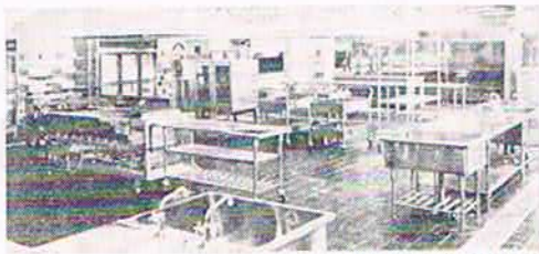
(高純水調製センター設計・施工)

工 販 備 施 設 計 製 設 製 備 設 庫 庫 房 器 厨 機 冷 庫 綜 合 各 種