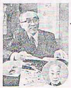
二代目鴈治郎(田中)をしのぶ出版した様子を