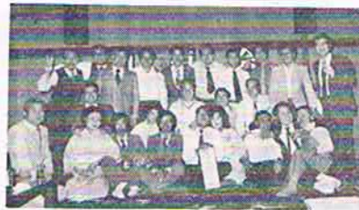
和 恒 会 (上六・天繁にて)