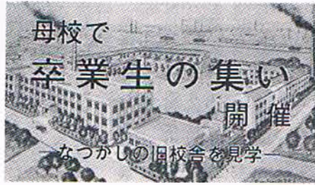
母校で卒業生の集い なつかしの旧校舎を見学

ひしひしと感じました。 小生の年代は戦争等の関係で卒業後も同期生の消息が仲々判明せず、クラス会を行う機会も少なく、五、六名の同期生との交流がある範囲で淋しく思っていました。 が、昨秋の集いで他科の同期や先輩後輩の方々との交