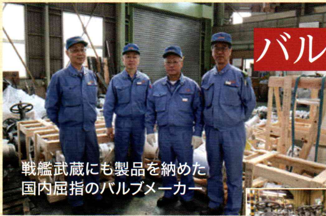
戦艦武蔵にも製品を納めた 国内屈指のバルブメーカー