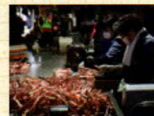
3,450坪もある広い敷地で、溶接器のホルダーなどを製作している。