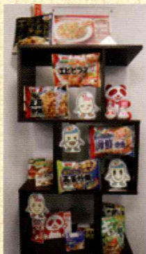
スーパーやコンビニの売場に並ぶ人気商品の多くをここで作っている。

近年ニュースで食品への異物混入が問題となっているが、コメックではそうしたトラブルを事前に100%防ぐため、万全の体制をとる。「取引先の原料の原料まで遡って確認し、エビの殻はすべて目視でチェック。社員が工場では着用するユニフォームも、ICタグで管理しているんです」。