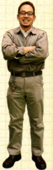
「職人の手による汎用機にしかできない価値を追求しています」と語る南社長。