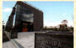
昨年できた旗艦店には個人客だけでなく内装のプロも集まる。