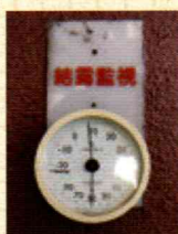
工場に設置された温度計。鉄にサビをもたらす湿気は大敵だ。

●大正区泉尾7-1-11 ☎06-6554-0320 http://www.kowaz.co.jp