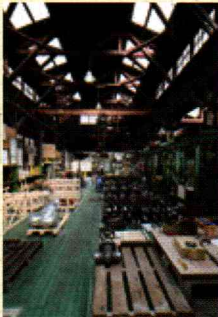
工場の一部には、昭和の歴史を彷彿させる木造トラス構造がそのまま残っている。

●大正区北村2-1-13 ☎06-6552-3161 http://www.utsue-valve.co.jp