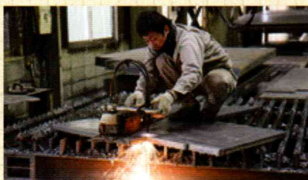
切断したい部分をガストーチで溶かし、高圧ガスを吹きかけて溶断していく。