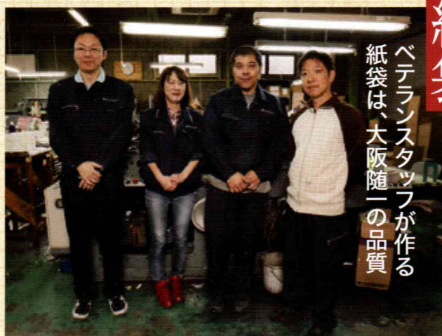
スタッフの多くも会社の近くに住む大正区民だ。