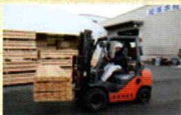
港の広い敷地には、出荷を待つ木材が整然と積まれている。