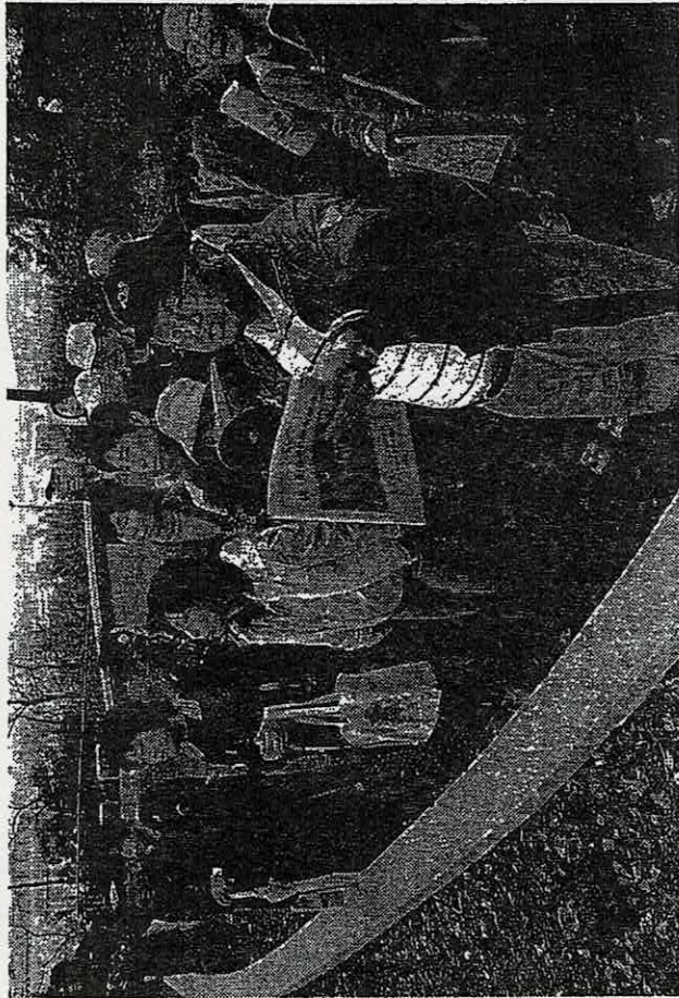
西村区長のガイドで昭和山からの景色を楽しむ参加者ら