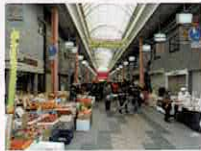
サンクス平尾 (平尾本通り商店街)

大阪市営交通に 関するお問い合わせ 大阪市交通局ホームページ http://www.kotsu.city.osaka.lg.jp/ 大阪市交通局