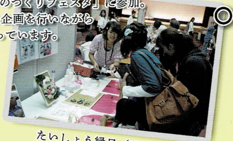
たいしょう縁日（手作り作家市）