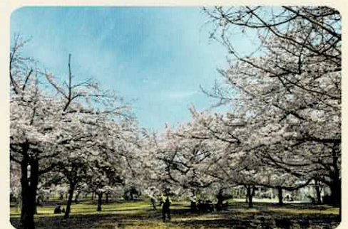
四季折々の風景が楽しめる小林公園