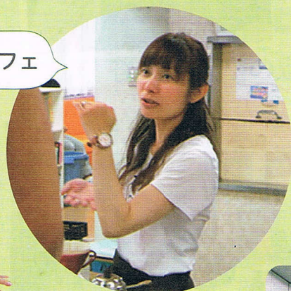
ハンドパンという楽器演奏