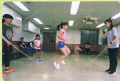
ダブルダッチ体験会