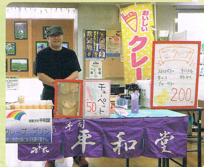
和菓子屋さんの クレープ&プリン